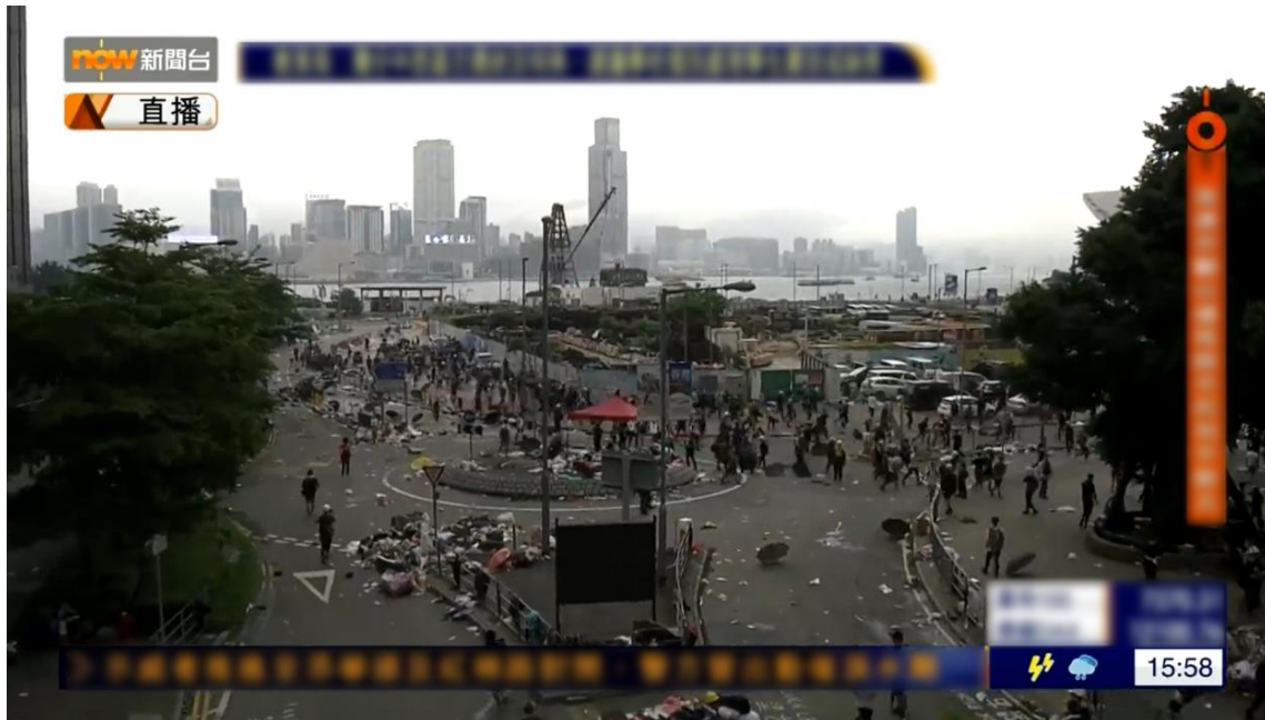
圖片 8-15：下午 3 時 58 分，大部分示威者走到龍匯道 (圖片來源：Now 新聞)