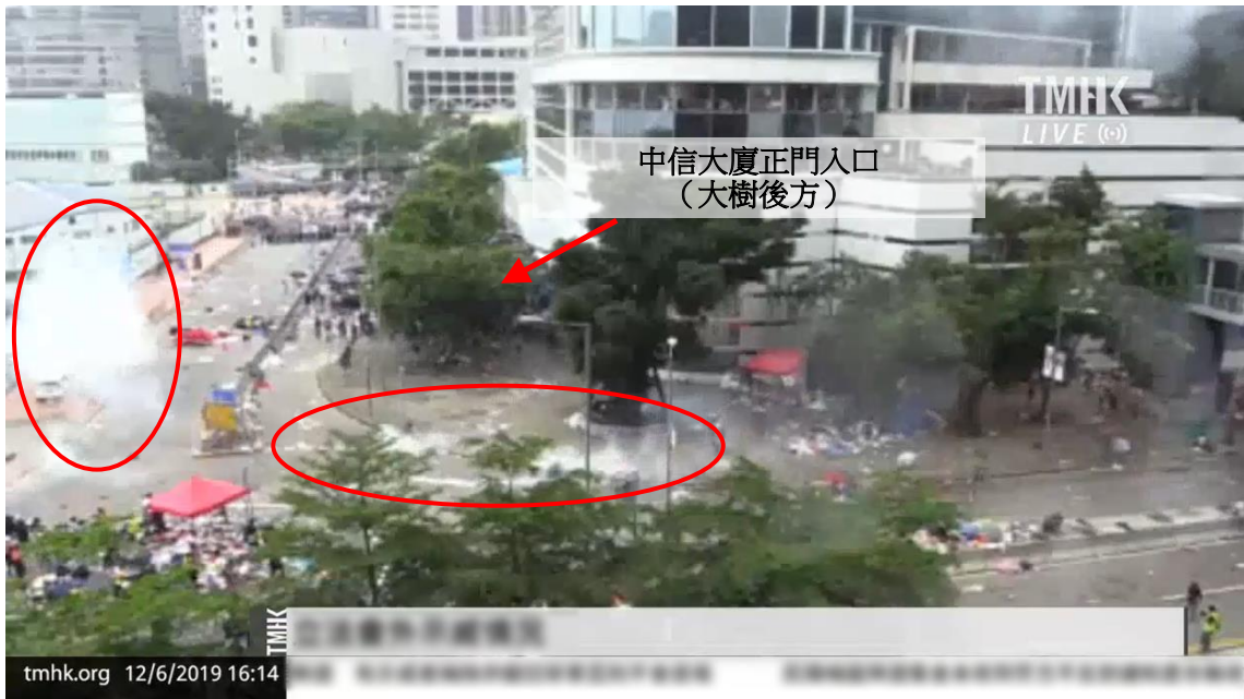
圖片 8-24：下午 4 時 14 分，添美道和龍匯道的情況