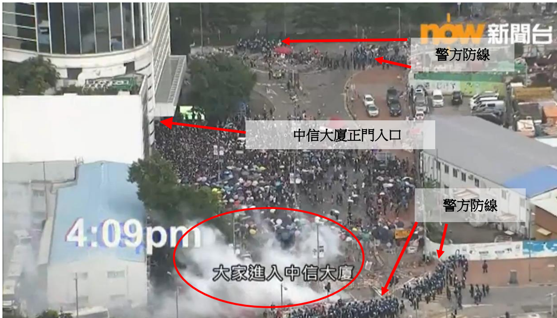
圖片 8-18：下午 4 時 09 分，龍匯道的情況