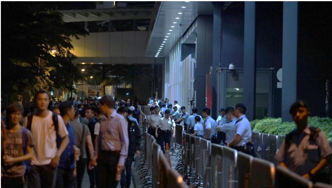
圖片 8-1：6月11日晚上，立法會綜合大樓外的情況