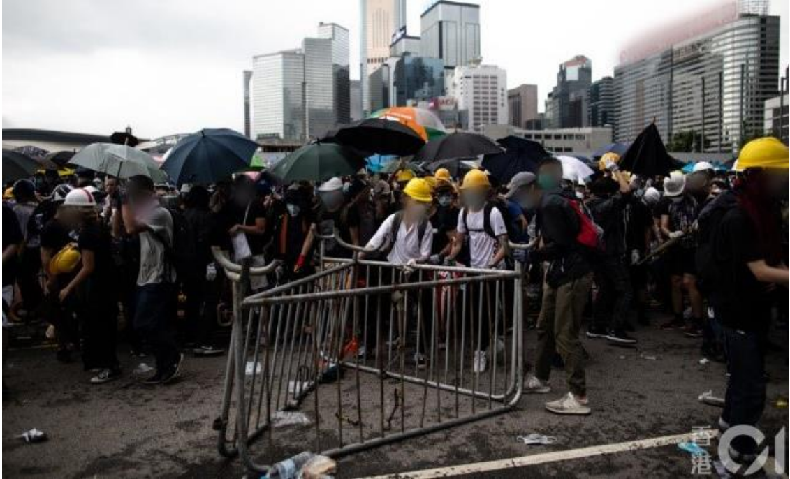
圖片 8-8：下午 3 時 26 分，立法會道的情況