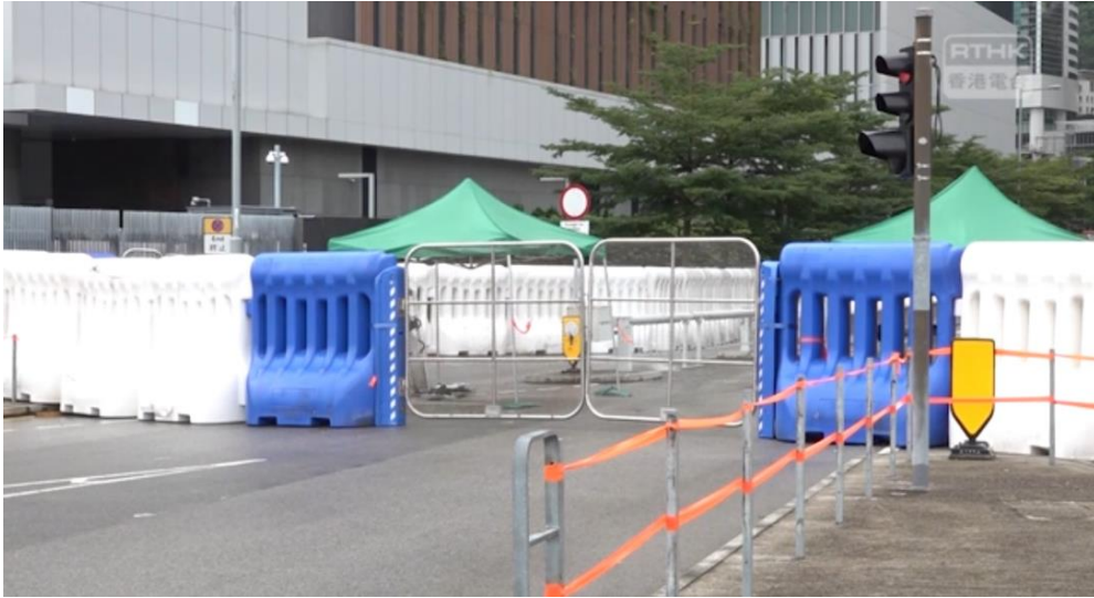
圖片 8-30：自 2019 年 7 月下旬起在政府總部外置設水馬