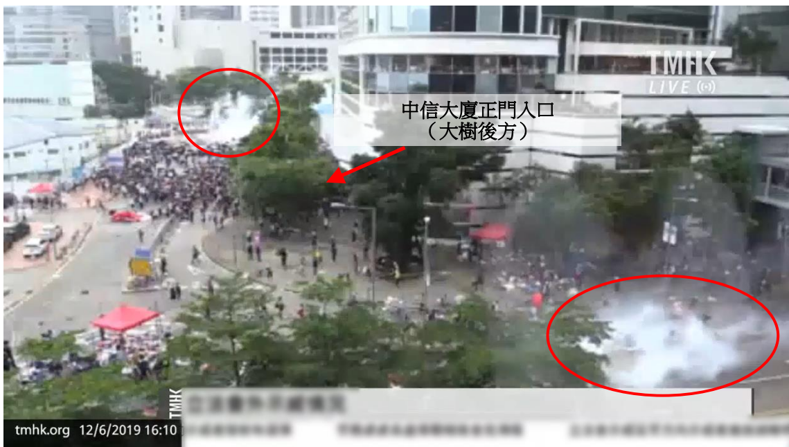
圖片 8-19：下午 4 時 10 分，添美道和龍匯道的情況