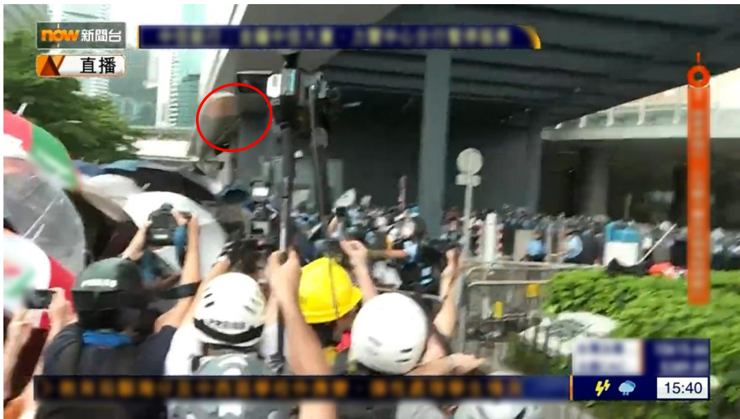
圖片 8-10：下午 3 時 40 分，立法會綜合大樓車輛通道入口的情況