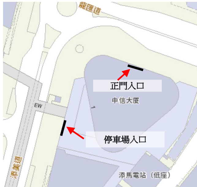
地圖8-5：中信大廈正門及停車場入口