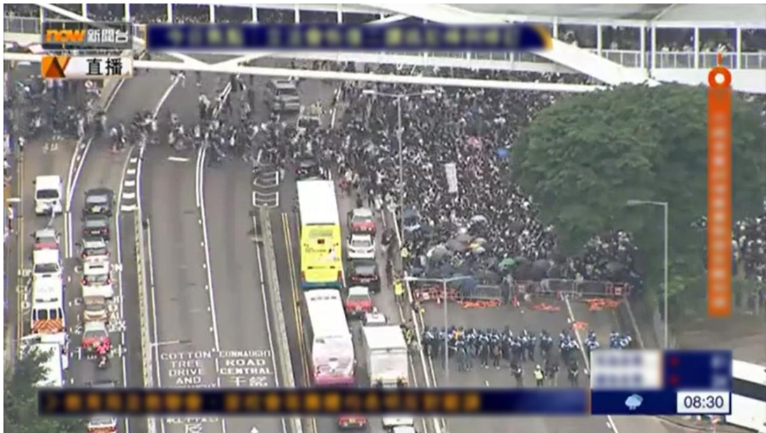
圖片 8-3：上午8時30分，夏慤道的情況