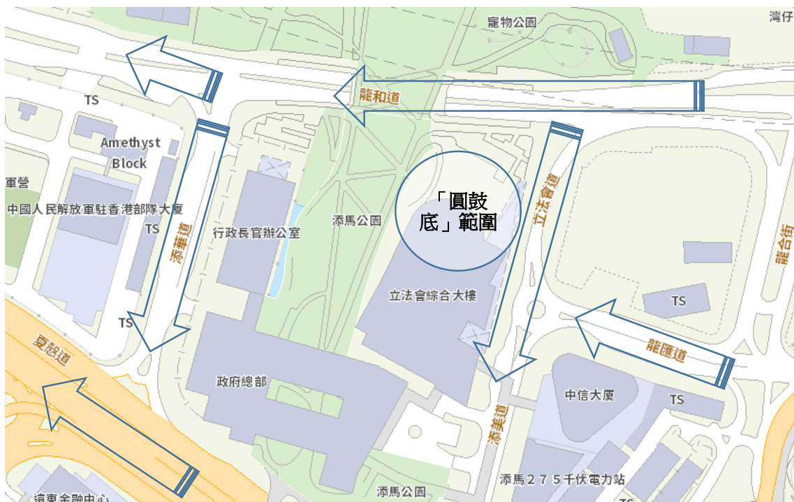
地圖 8-4：警方清場行動方向