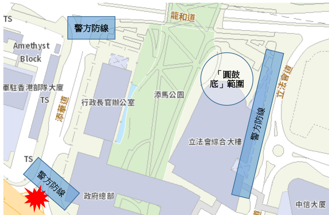
地圖 8-2：夏慤道與添華道交界爆發衝突