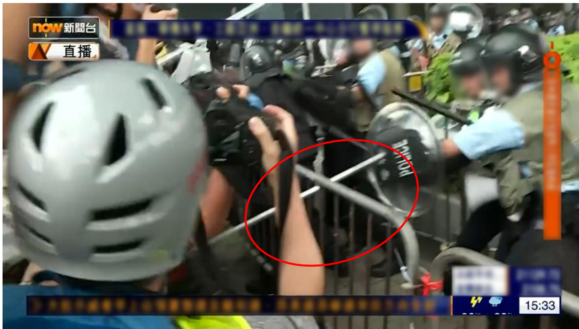
圖片 8-9：下午 3 時 33 分，立法會綜合大樓車輛通道入口的情況