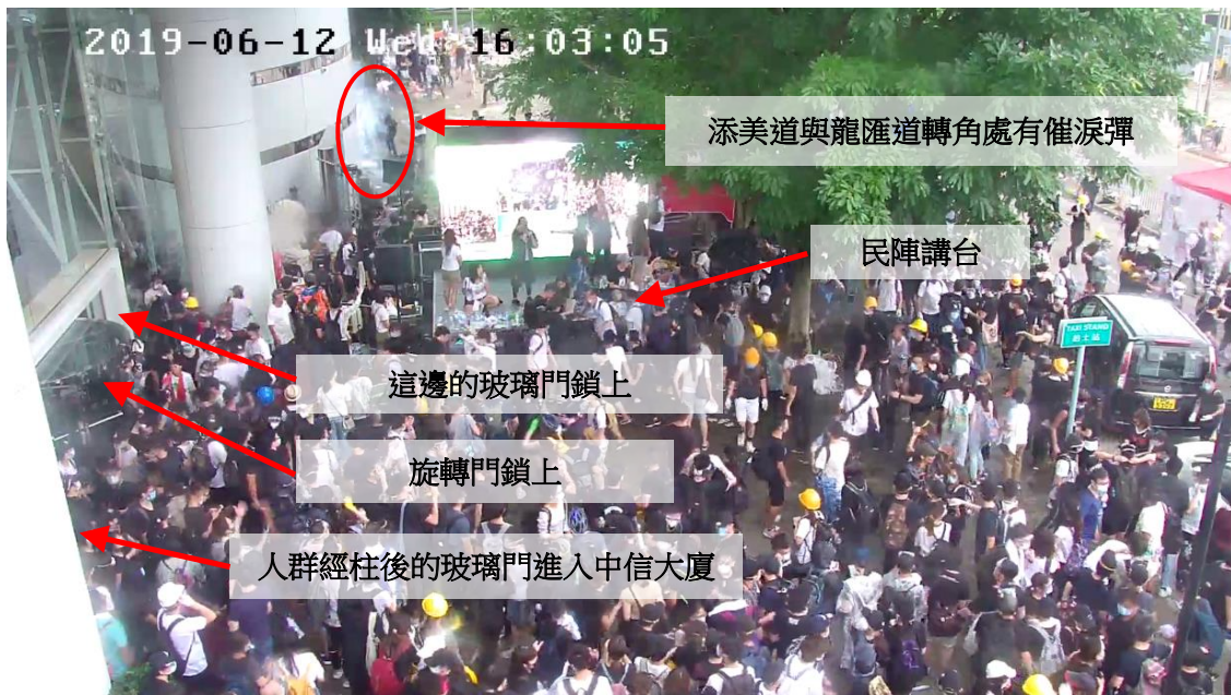
圖片 8-17：下午 4 時 03 分，中信大廈正門入口的情況