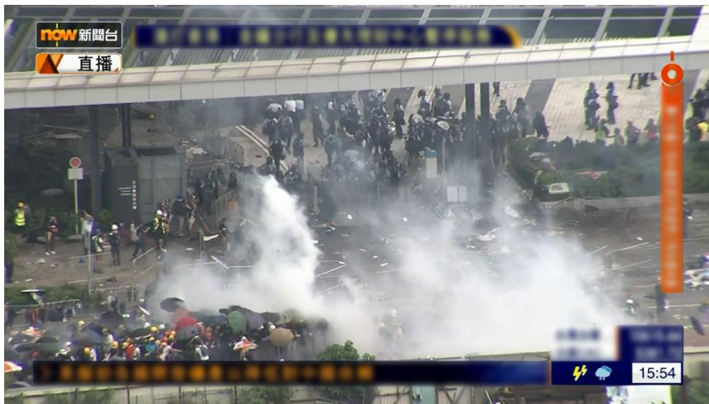
圖片 8-12：下午 3 時 54 分，立法會道的情況