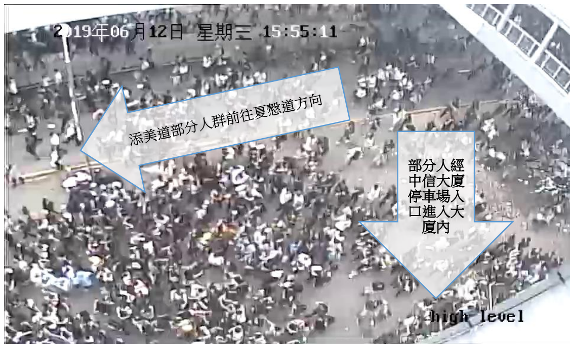
圖片8-13：下午3時55分，添美道的情況