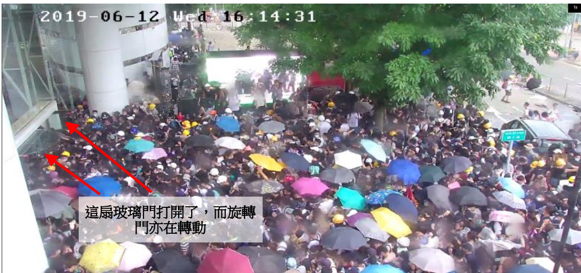
圖片 8-28：下午 4 時 14 分，中信大廈正門入口的情況