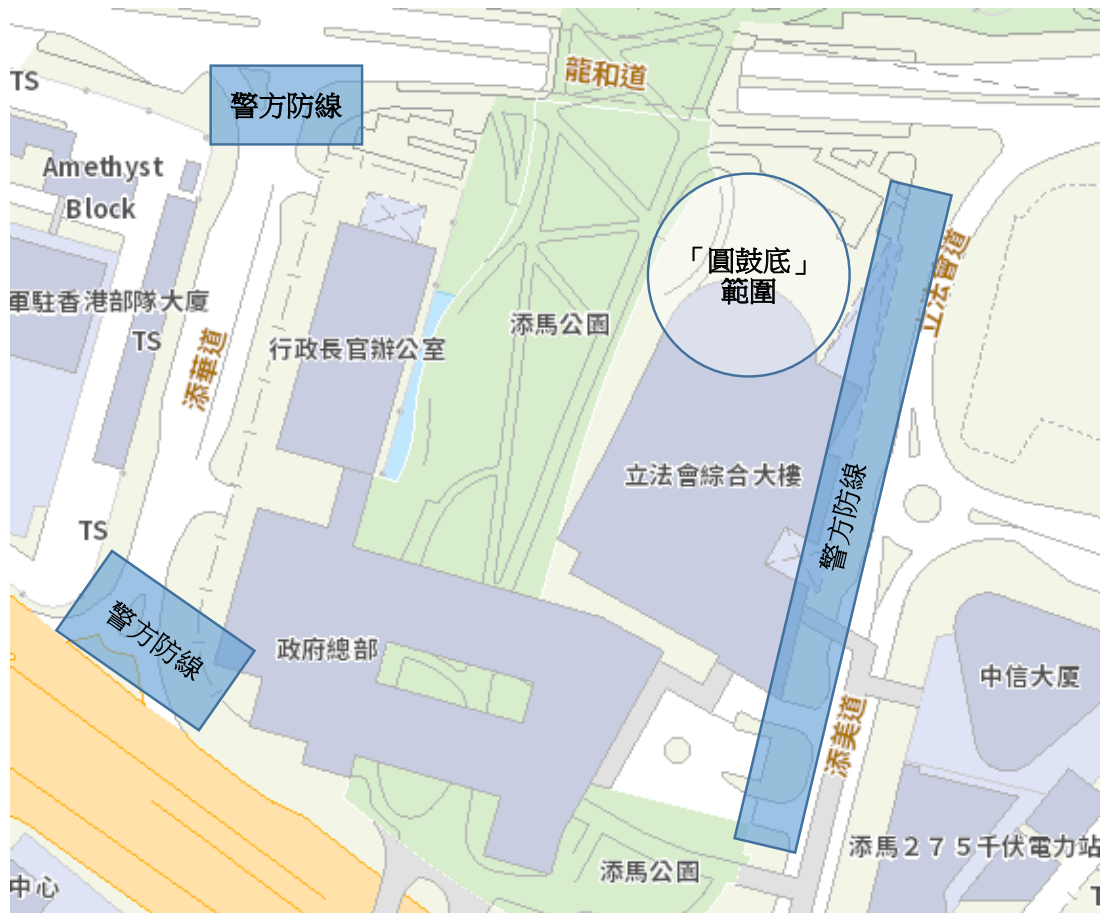
地圖 8-1：政府總部一帶的警方防線

8.13 警察總部指揮及控制中心在大約下午 4 時發出清場行動指示，以驅散在政府總部一帶的示威者，驅散方向由東至西，再從北到南。