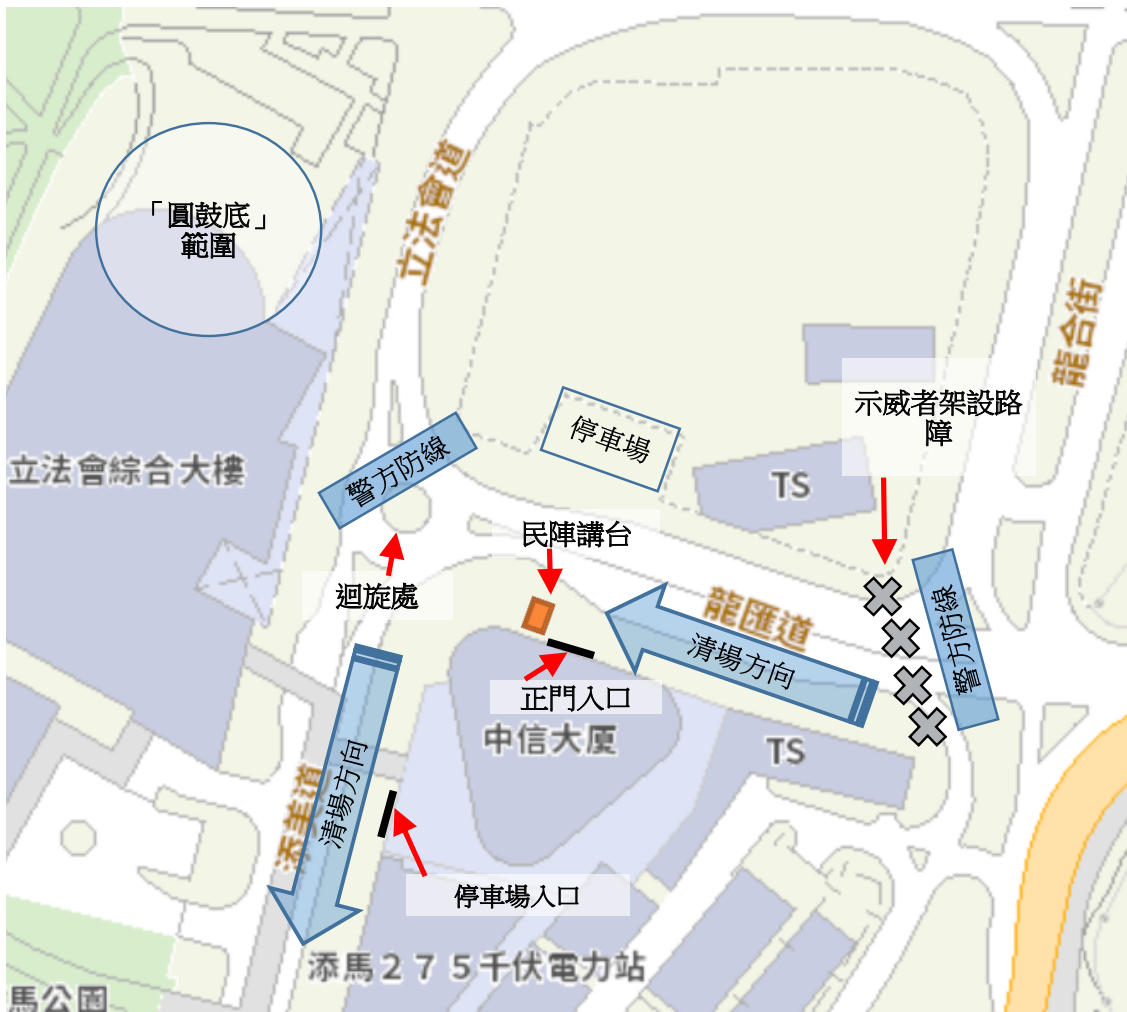
地圖 8-6：下午 4 時 03 分，警方的防線及清場方向