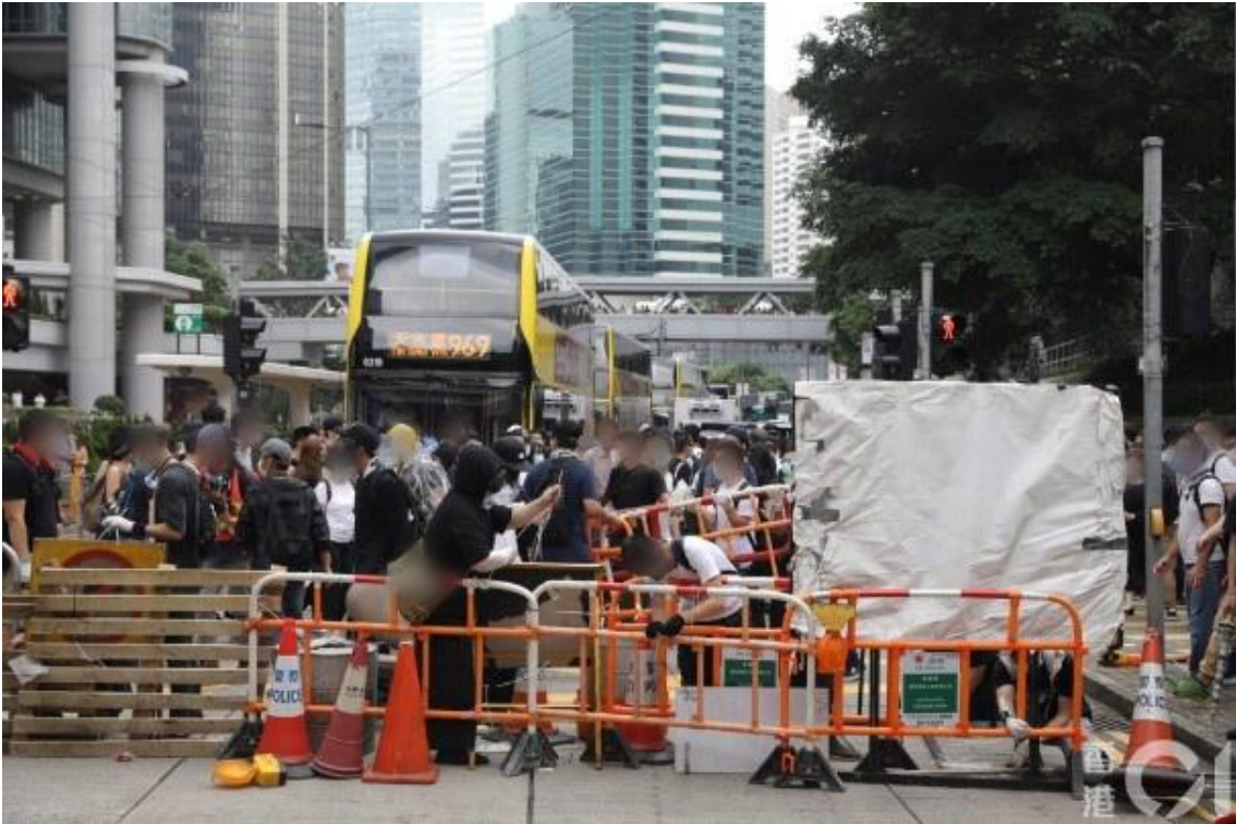
圖片 8-7：上午 11 時 52 分，金鐘道的情況