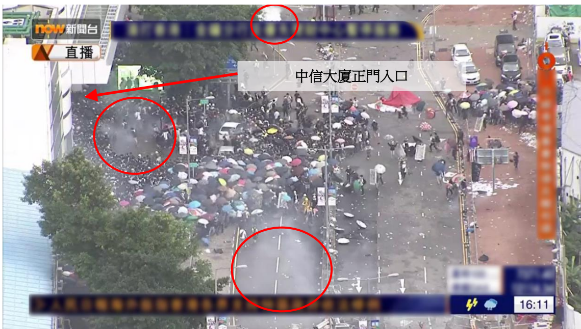
圖片 8-21：下午 4 時 11 分，龍匯道的情況