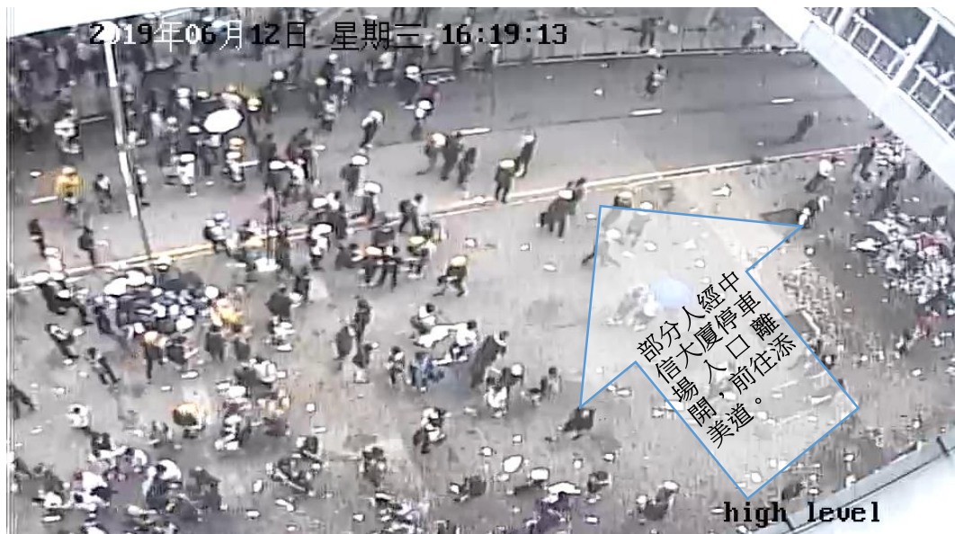
圖片 8-29：下午 4 時 19 分，添美道的情況