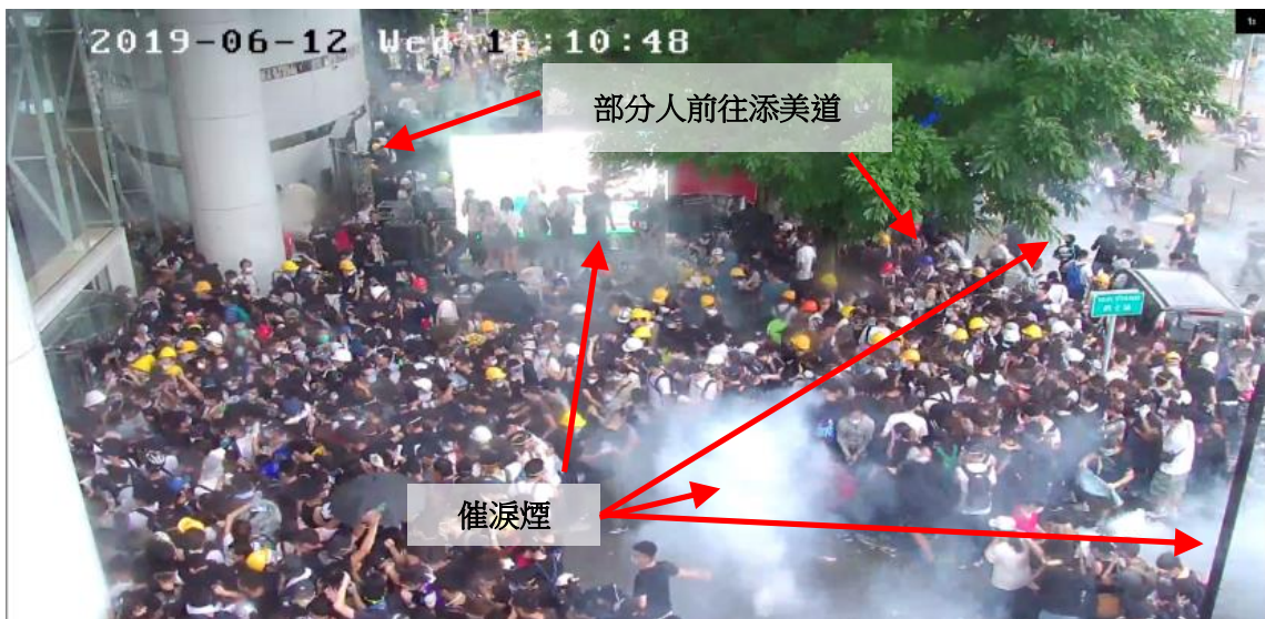
圖片 8-25：下午 4 時 10 分 33 秒至 4 時 11 分 14 秒 中信大廈正門入口可以見到催淚煙