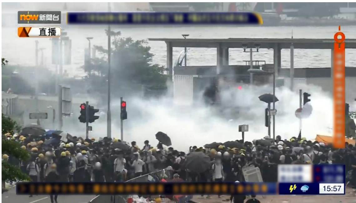
圖片 8-14：下午 3 時 57 分，立法會道與龍和道交界的情況