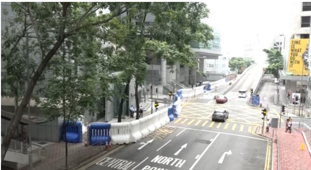
圖片 8-31：自 2019 年 7 月下旬起在警察總部外置設水馬