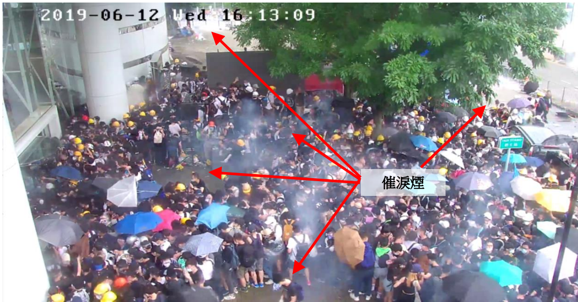
圖片 8-26：下午4時12分55秒至4時13分25秒