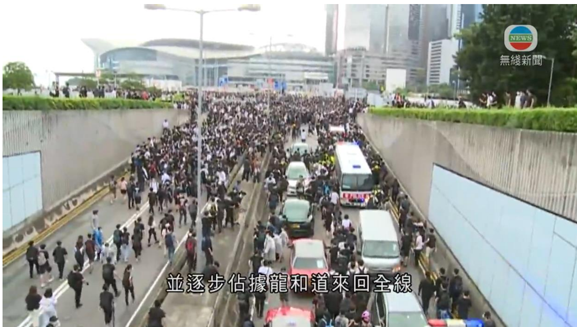
圖片 8-2：大約上午 8 時，龍和道的情況