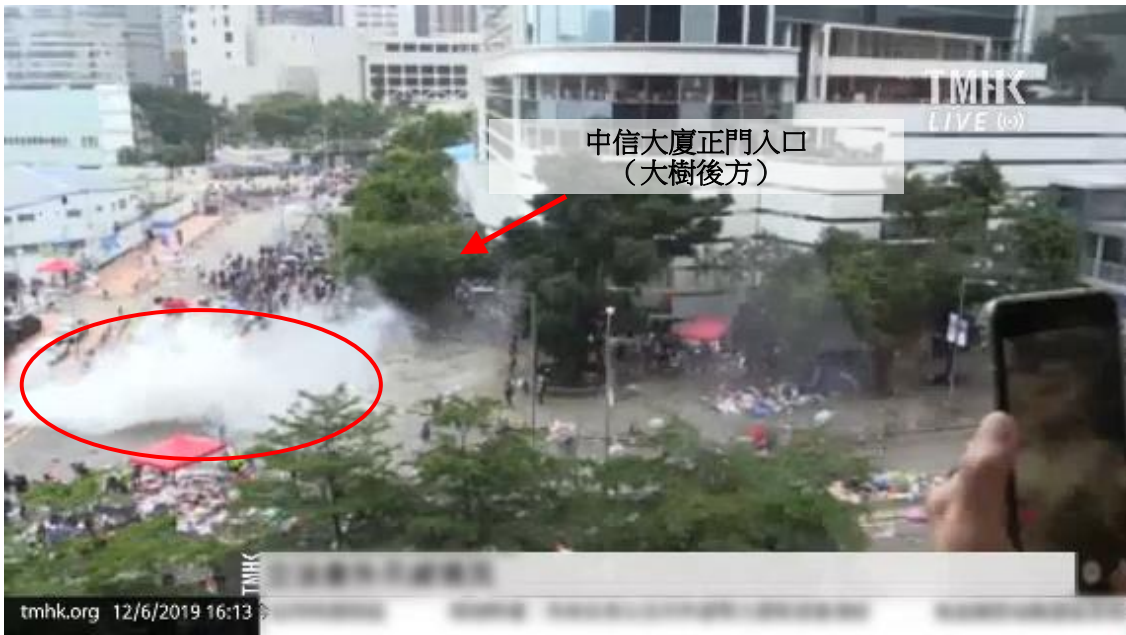
圖片 8-23：下午 4 時 13 分，添美道和龍匯道的情況