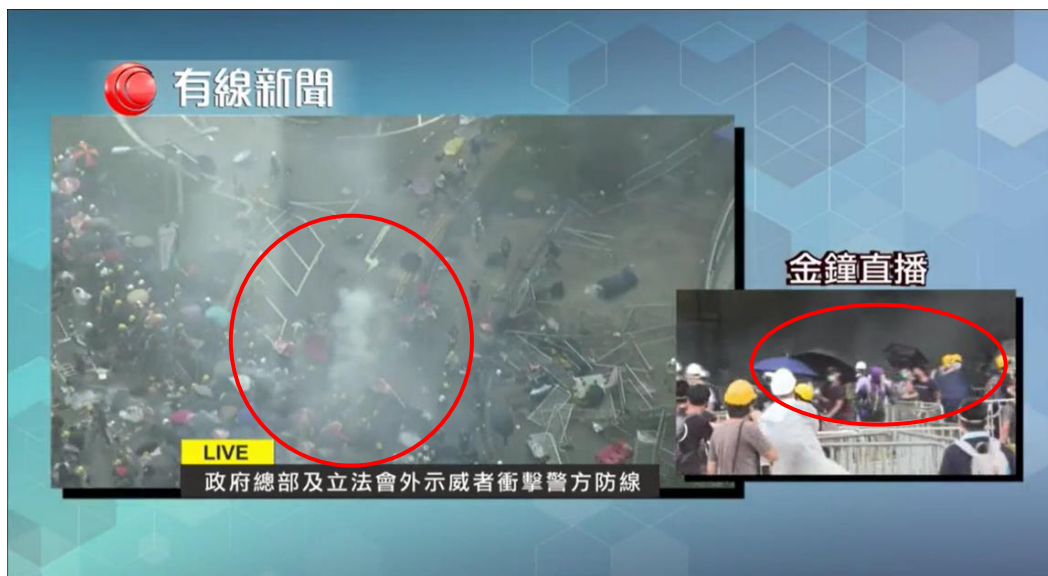
圖片 8-11：下午 3 時 47 分 添華道（左）及立法會綜合大樓「圓鼓底」範圍（右）有催淚煙