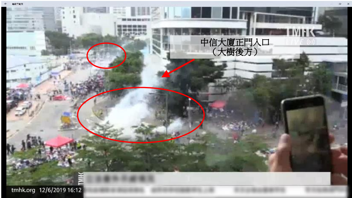
圖片 8-22：下午 4 時 12 分，添美道和龍匯道的情況