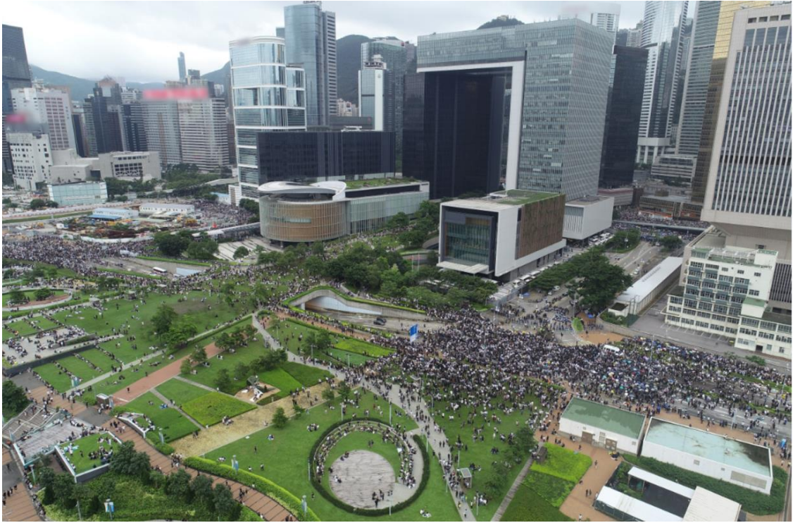
圖片 8-4：上午 10 時 10 分，政府總部一帶的情況