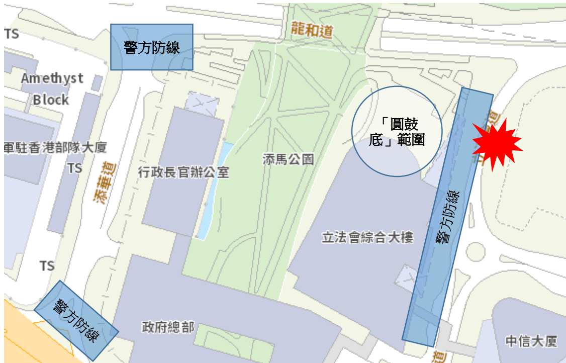
地圖 8-3：立法會道爆發衝突