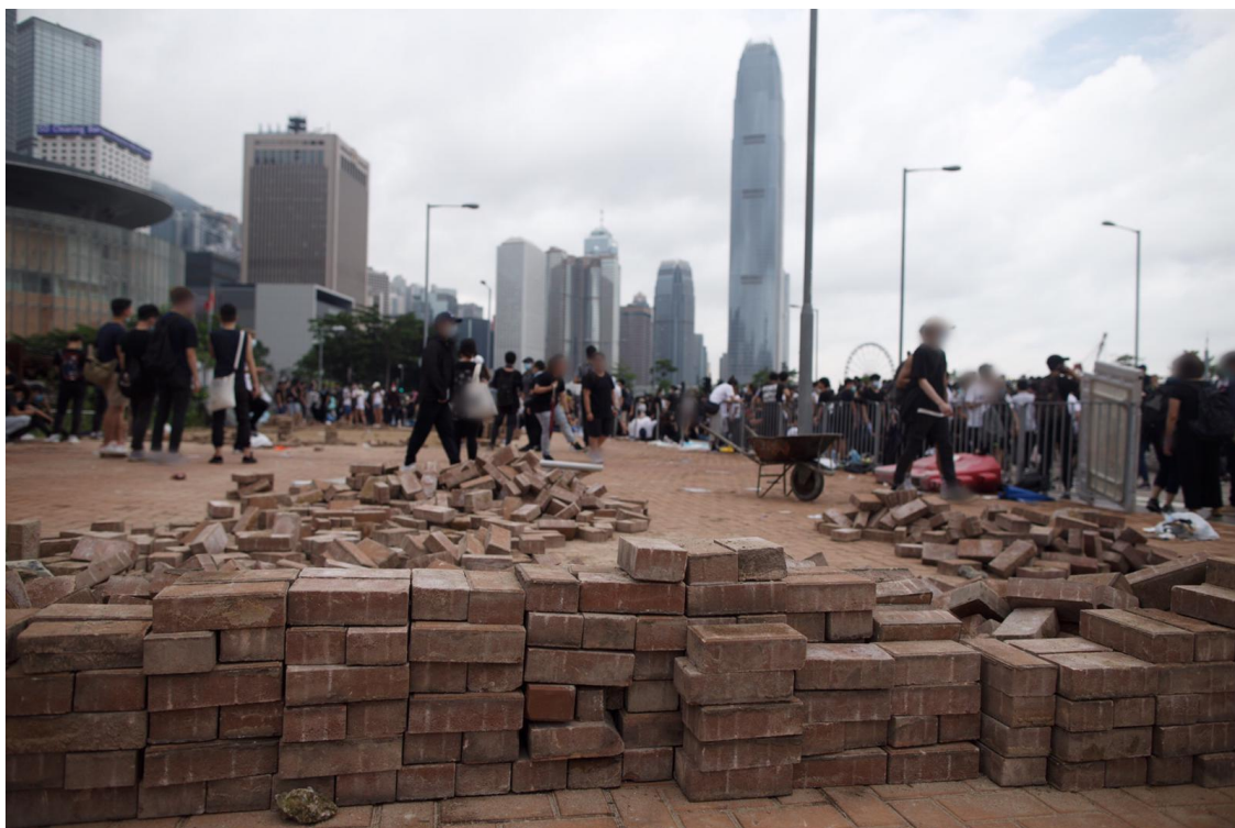
圖片 8-5：龍和道行人路的磚頭被掘起