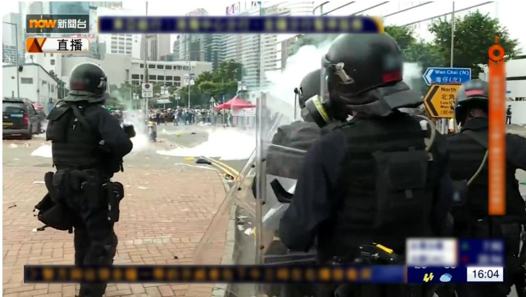
圖片 8-16：下午 4 時 04 分，龍匯道西端有催淚彈