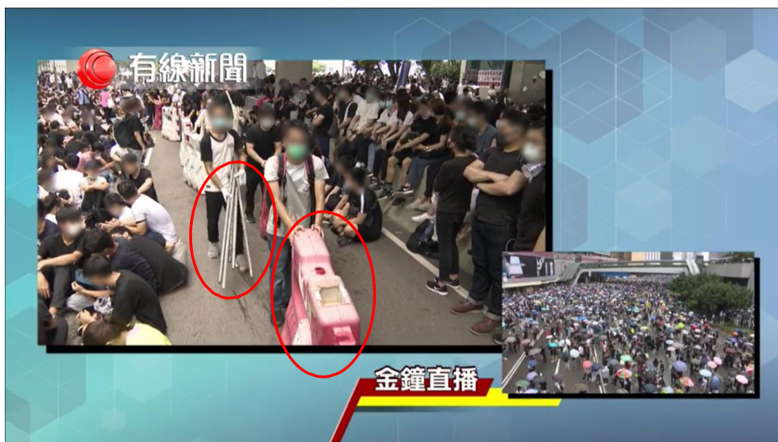
圖片 8-6：沿添美道搬動鐵枝及水馬