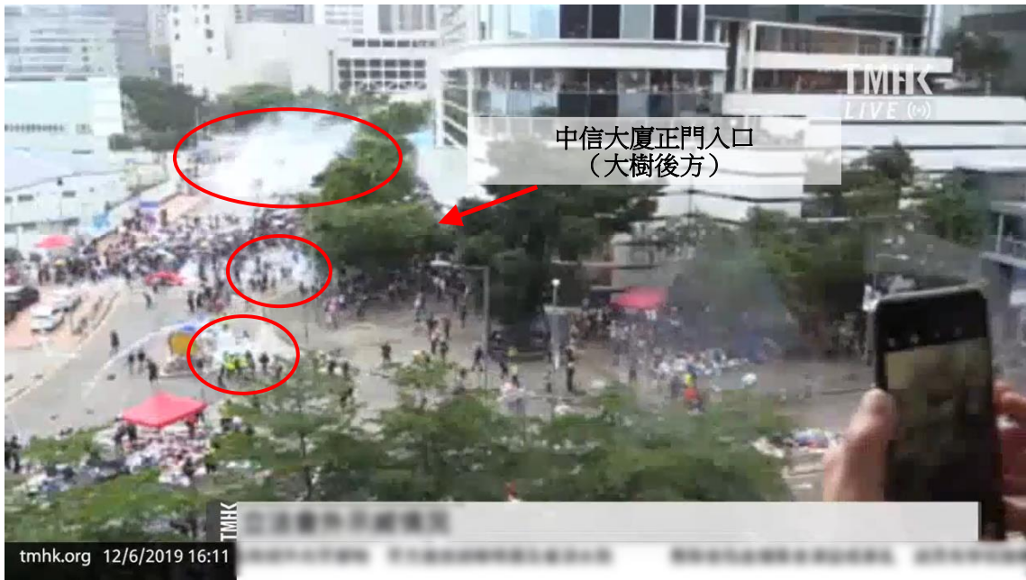
圖片 8-20：下午 4 時 11 分，添美道和龍匯道的情況